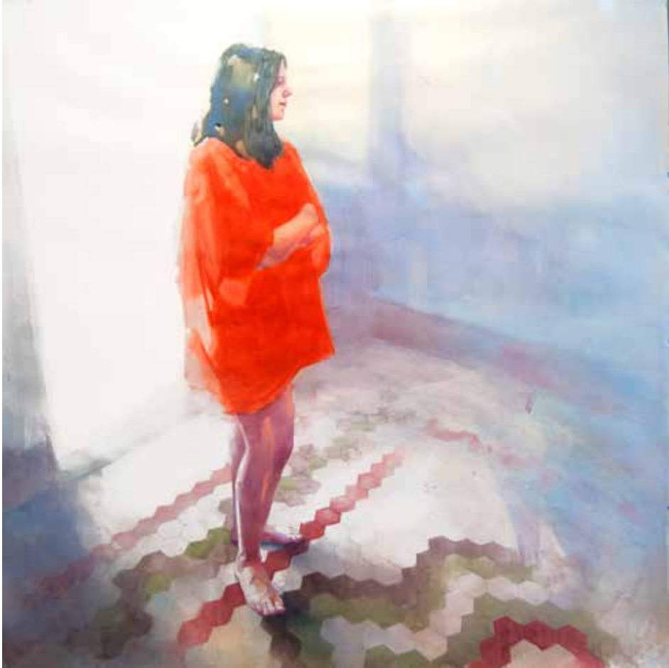
Sans titre. Aquarelle sur papier. 150 x 150 cm.