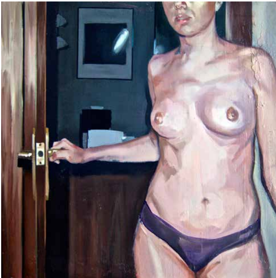
De "Inside the intime" série. Huile sur toile. 55 x 55 cm.