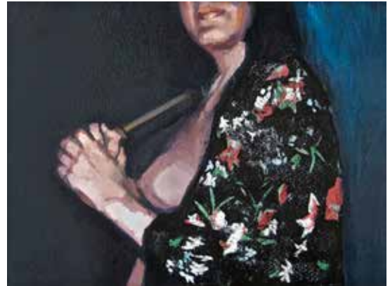
Paysage Sawall. Huile sur toile de lin. 30x 40 cm. / De "Inside the intime" série. Huile sur papier. 20 x 30 cm. De "Inside the intime" série. Huile sur toile. 28 x 38 cm. / De "Inside the intime" série. Huile sur papier. 33 x 24 cm.