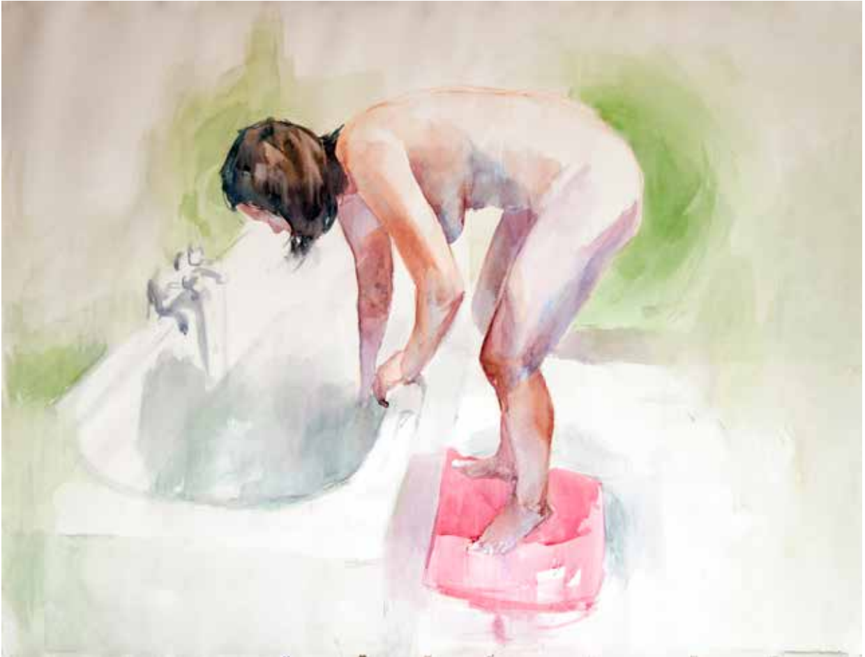
Sans titre. Aquarelle sur papier. 120 x 150 cm.