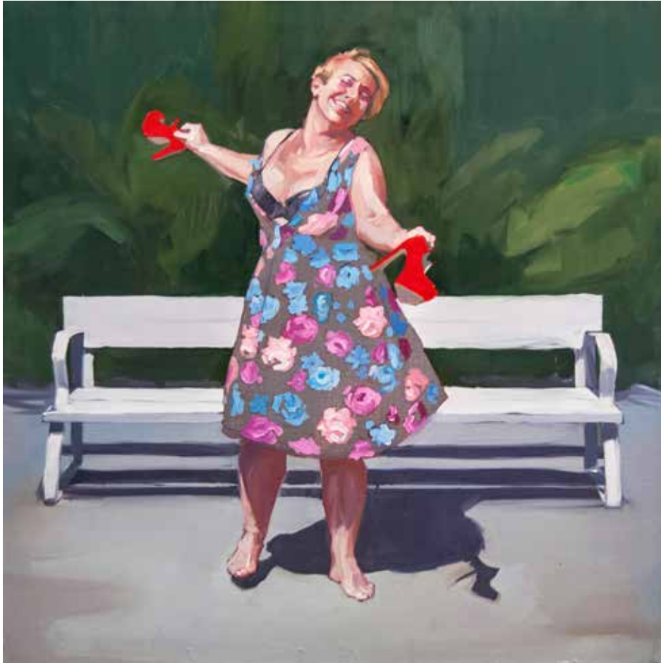
La joie de vivre, par opposition à l'idée d'aborder la mort. Huile sur toile. 50 x 50 cm.