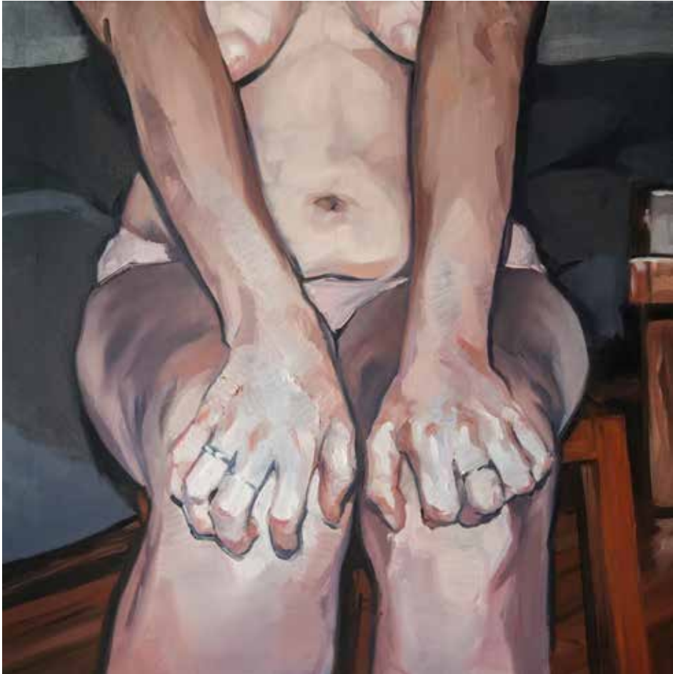
De "Inside the intime" série. Huile sur toile. 55 x 55 cm.