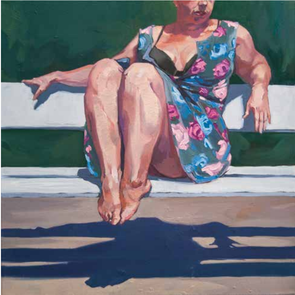
Banc blanc et ombre. Huile sur toile. 50 x 50 cm.