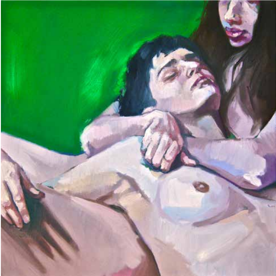
De "Inside the intime" série. Huile sur toile. 40 x 40 cm.